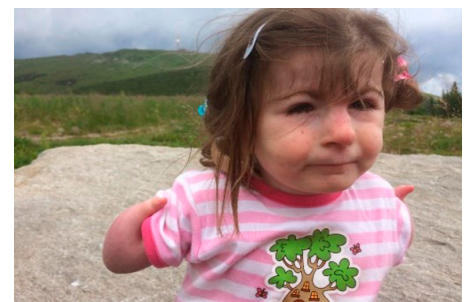
Obrázok 2, 3: V čase klinicko-logopedickej intervencie mala pacientka 6,5 roka