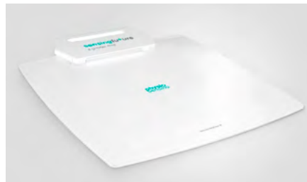
Obrázek 2: Příklad plantografické plošiny ( www.physiosensing.net ; 2018)

Pro terapii poruch rovnováhy je často využívána stabilometrická nebo plantografická plošina (obr. 2), pomocí níž lze sledovat polohu kolmého průmětu těžiště pacienta na plošinu nebo i detailnější rozložení tlaku pod chodidlo (Corbetta, D. et al.; 2015). Je možné detekovat a terapeuticky ovlivnit například snížený rozsah pohybu těžiště do všech směrů nebo stranovou asymetrii stoje.