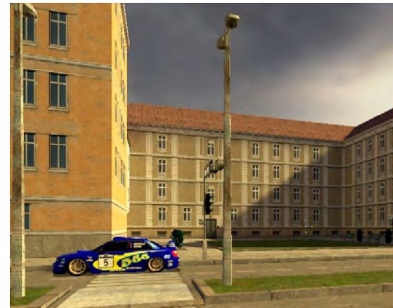
Obrázek 3: Virtuální terapeutická scéna přechod přes silnici (Tichá, M. et al.; 2014)

V průběhu terapie je možné simulovat problémové situace zaměřené na aktivity běžného života, například nakupování nebo přechod přes rušnou silnici (obr. 3). Pro nácvik řízení motorových vozidel mohou být využívány trenážery s volantem a pedály.