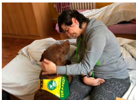
Klientka s afázií a dysartrií po těžkém kraniotraumatu 1

Průměrně provádíme terapii u osmi pacientů denně, někdy doprovázíme klienta například k soudu jako komunikátoři či napomáháme klientům v komunikaci s Centry duševního zdraví. Logopedická terapie ve zdravotnickém prostředí je vždy indikována lékaři, po vyšetření společně vyhodnocujeme, zda je logopedická terapie vhodná či vůbec možná, a snažíme se objasnit cíle terapie a klienta motivovat k zahájení terapie.