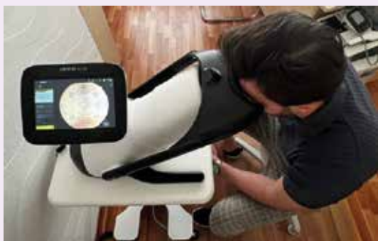
Obr. 1 | Vyšetrenie funduskamerou.

Pravidelné vyšetovanie je nevyhnutné pre včasný skrining DR a VPDM. Na Slovensku len približne 45 % diabetikov podstupuje pravidelné očné skriningové vyšetrenia [4]. Moderné technológie – nemydriatické kamery a softvér umelnej inteligencie – umožňujú rozpoznať lézie, urobiť skriningové vyšetrenie diabetickej retinopatie, znížiť diagnostickú záťaž pre očných špecialistov, časové náklady pre pacientov a zachytiť prípady s novozistenými mikrovaskulárnymi komplikáciami diabetu včas.