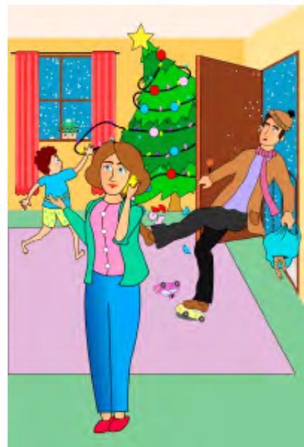
Obrázok 1: Elicitálny obrázok Vianoce

Dáta boli štatisticky spracované v programe jamovi 2.4.8. Vzhľadom na non-normálne rozdelenie dát sme na porovnanie výkonov troch skupín použili neparametrický Kruskal-Wallis test a pre vzájomné porovnanie skupín medzi sebou sme použili Dwass-Steel-Critchlow-Fligner post-hoc test. Rozdiel sme považovali za štatisticky významný v prípade p < 0,05 . Na vyjadrenie veľkosti rozdielu (effect size) vzhľadom na využitie neparametrických testov uvádzame hodnoty epsilon kvadrátu.