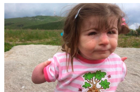
Obrázok 2, 3: V čase klinicko-logopedickej intervencie mala pacientka 6,5 roka