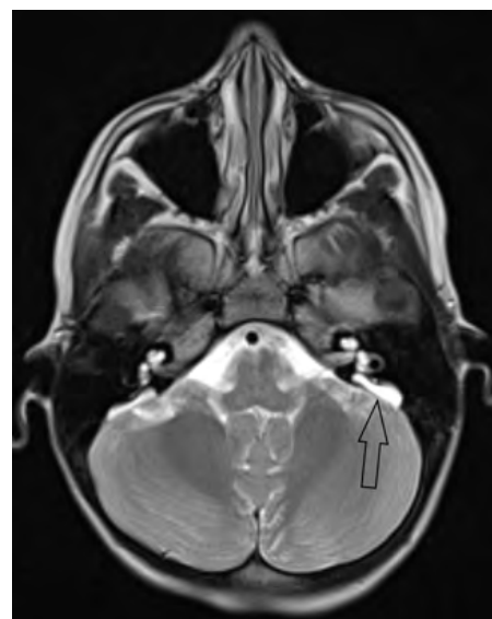
Obrázek 5: EVA syndrom

vzdušné vedení, při progredující velmi těžké nedoslýchavosti je indikována kochleární implantace. Rehabilitace je s velmi dobrými výsledky (Dewan, 2009, Sennaroglu, 2002) (obr. 5).