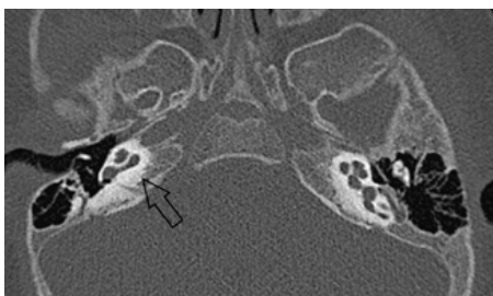
Obrázek 2: Mondiniho malformace

Kochlea je menší, má vyvinut pouze bazální závit, střední a apikální je cysticky změněn, bez centrálního modiolu. Součástí Mondiniho malformace je rozšířený vestibulární akvadukt a dilatace vestibula. Postižení sluchu je variabilní, většinou je ale přítomna porucha sluchu těžkého stupně. Mondiniho malformace je součástí mnoha syndromů. Další častou variantou poškození kochleje je společná dutina – common cavity, kdy dochází ke spojení kochleje a vestibula bez vytvoření vnitřních struktur membranózního labyrintu. Smyslové buňky jsou rozmístěny po obvodu cysty. Nervové zásobení je většinou chudší ve srovnání s normálně vytvořenou kochleou. Sluchové postižení je těžkého stupně (obr. 3, 4). Pacienti s Mondiniho malformací mohou profitovat z konvenčních sluchadel v případě lehkého poškození sluchu, většinou však podstupují kochleární implantaci, zpravidla s velmi dobrými výsledky. Stejně tak pacienti s common cavity (Mazón, 2017, Sennaroglu, 2002, Yiin, 2011).