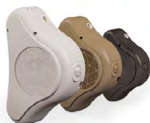
Obrázek 4: Audio procesor systému ADHEAR, který se připevňuje na adaptér