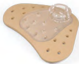
Obrázek 3: Adhezivní adaptér, který se lepí na kůži za ucho