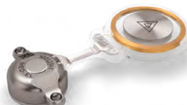
Obrázek 5: Bonebridge – aktivní transkutánní implantát pro kostní vedení, vnitřní část