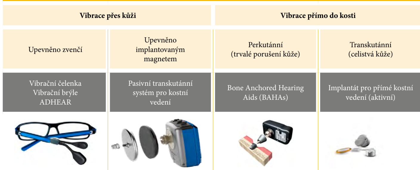
Tabulka 1: Zařízení pro kostní vedení zvuku

Historicky byla jako první používána zařízení, u kterých se vibrace šíří přes kůži. Dodnes se používají především u nejmenších dětí. Tyto vibrační pomůcky mají však mnoho nevýhod. Princip fungování je založen na tlaku vibrátoru na lebku, většinou pomocí čelenky (obrázek 1). To způsobuje časté otlaky, zarudnutí a bolestivost v místě vibrátoru, výjimkou nejsou ani opakované bolesti hlavy (Verhagen, 2008). Nezanedbatelný je i komfort nošení a estetický dojem, který není pacienty vnímán pozitivně. Především nejmenší děti, u kterých se používají vibrátory na čelence, odmítají tato zařízení nosit. Jednou z nejnovějších alternativ k vibračním čelenkám je ADHEAR, výrobek rakouské společnosti MedEl (obrázek 2). Sestává z adaptéru, jenž se nalepí za ucho do oblasti bradavčitého výběžku, a vlastního procesoru, který se následně připevní na adaptér (obrázek 3 a 4). Procesor zachytává zvukové informace z okolí, transformuje je na vibrace, které se pak přenáší na lebeční kost. Největší výhodou je fakt, že ADHEAR je „pressure free“, znamená to, že přenos vibrací není závislý na tlaku vibrátoru na kůži. Odpadají tak tradiční výše popsané komplikace. Navíc je zde i benefit z estetického hlediska. ADHEAR je vhodnou variantou k rehabilitaci sluchu jak u dětí, tak u dospělých, což dokazuje již několik studií (Urík, 2019, Dahm, 2018, Neumann, 2019).