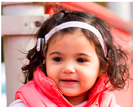
Obrázek 1: Baha softband – vibrátor na čelence.