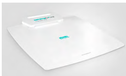
Obrázek 2: Příklad plantografické plošiny ( www.physiosensing.net ; 2018)

Pro terapii poruch rovnováhy je často využívána stabilometrická nebo plantografická plošina (obr. 2), pomocí níž lze sledovat polohu kolmého průmětu těžiště pacienta na plošinu nebo i detailnější rozložení tlaku pod chodidlo (Corbetta, D. et al.; 2015). Je možné detekovat a terapeuticky ovlivnit například snížený rozsah pohybu těžiště do všech směrů nebo stranovou asymetrii stoje.