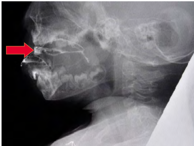
Obrázok 2: Laterálna projekcia, orálna prípravná fáza s poruchou orálnej kontroly, šípka označuje miesto polohy sústa

ciest, činnosť faryngeálnych konstriktorov) a začiatok ezofageálnej fázy. Pre vylúčenie asymetrie štruktúr zvolíme tzv. A/P (pre-dožadnú) projekciu (Frey, 2011, Biber, 2012, Neumann, Nightingale, 2012).