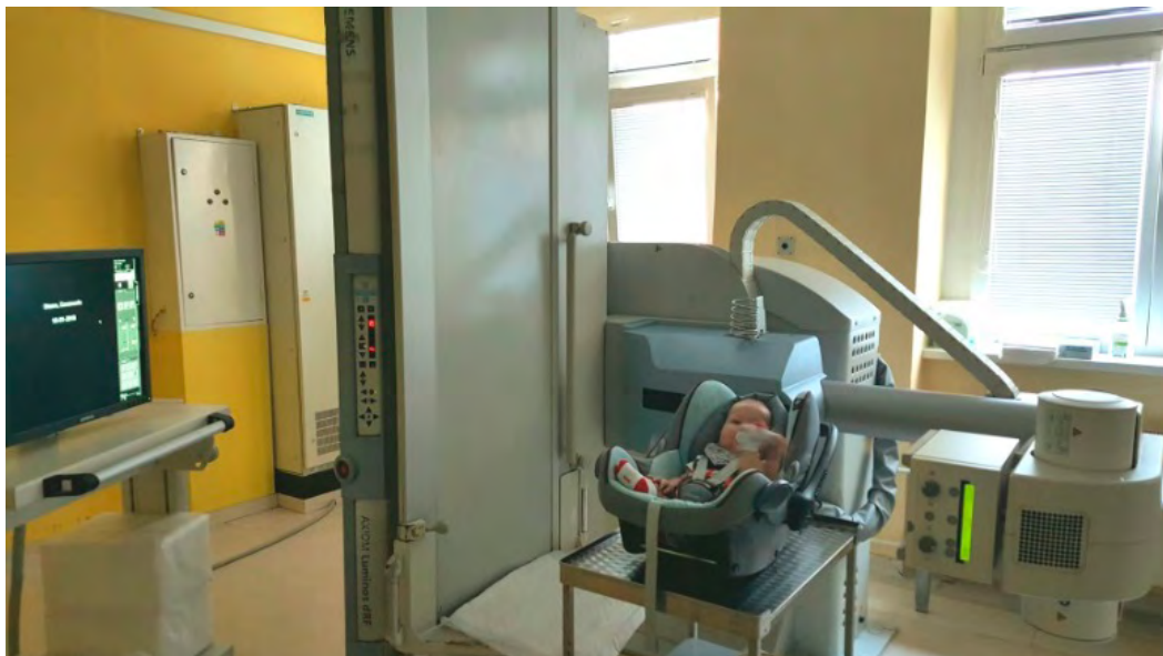
Obrázok 1.: Poloha dieťaťa pri VFSS

Poloha dieťaťa pri VFSS: Dieťa je buď v polosede, sede, alebo stojí. Dojčatá a menšie deti môžu byť v kočíku alebo v autosedačke, väčšie na vozíku alebo v kresle so zabezpečenou správnu postúrou trupu, hlavy a krku (hlava nesmie byť zaklonená) (obr.1). Rozhodne by sme nemali realizovať vyšetřenie tak, aby dieťa držal na rukách rodič.