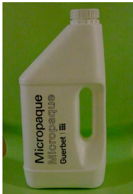
Obrázok 3: Kontrastná látka

Pomôcky na pitie a jedenie počas VFSS a použité konzistencie: kvôli transparentnosti vyšetrenia je dôležité, aby sa počas VFSS použili predmety (fľaša s cumľom, pohár, lyžička), ktorými je dieťa kŕmené doma a aby ho kŕmil človek, ktorý ho kŕmi každý deň. Ako kontrastná látka sa používa nejódová báriová kontrastná látka (obr. 3), ktorá je v prípade aspirácie dieťaťa šetrnejšia voči jeho pľúcam. Ak má dieťa problém so saním z fľaše s cumľom, použijeme striekačku alebo lyžičku. U väčších detí môžeme použiť pohár, alebo aj slamku. Obyčajne sa pri vyšetrení podávajú tri konzistencie: tekutá (mlieko, čaj), kašovitá (jogurt, jablčná výživa a iné výživy) a tuhá (koláč, keks, chlieb).