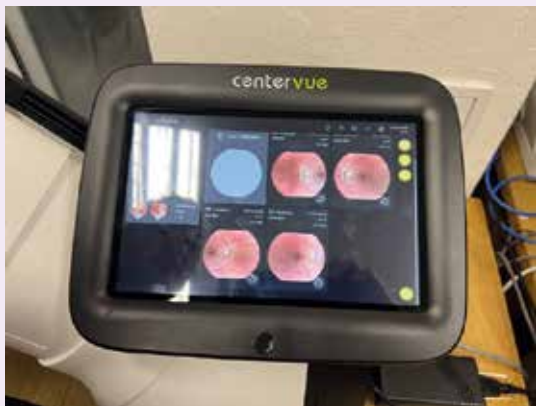
Obr. 1 | Zobrazenie skenov očnému pozadia nemydriatickou fundus kamerou na displeji

Najzávažnejšie, predtým nediagnostikované nálezy sa zistili väčšinou u pacientov v strednom ale aj v mladšom veku, ktorí sa pri vyťaženi nedostavili na očné vyšetrenie napriek tomu, že naňho boli diabetológom odoslaní. To dokazuje, že vykonávať skrining DR pomocou AI je vhodné práve na diabetologických ambulanciách, na ktorých je najväčšia koncentrácia diabe-